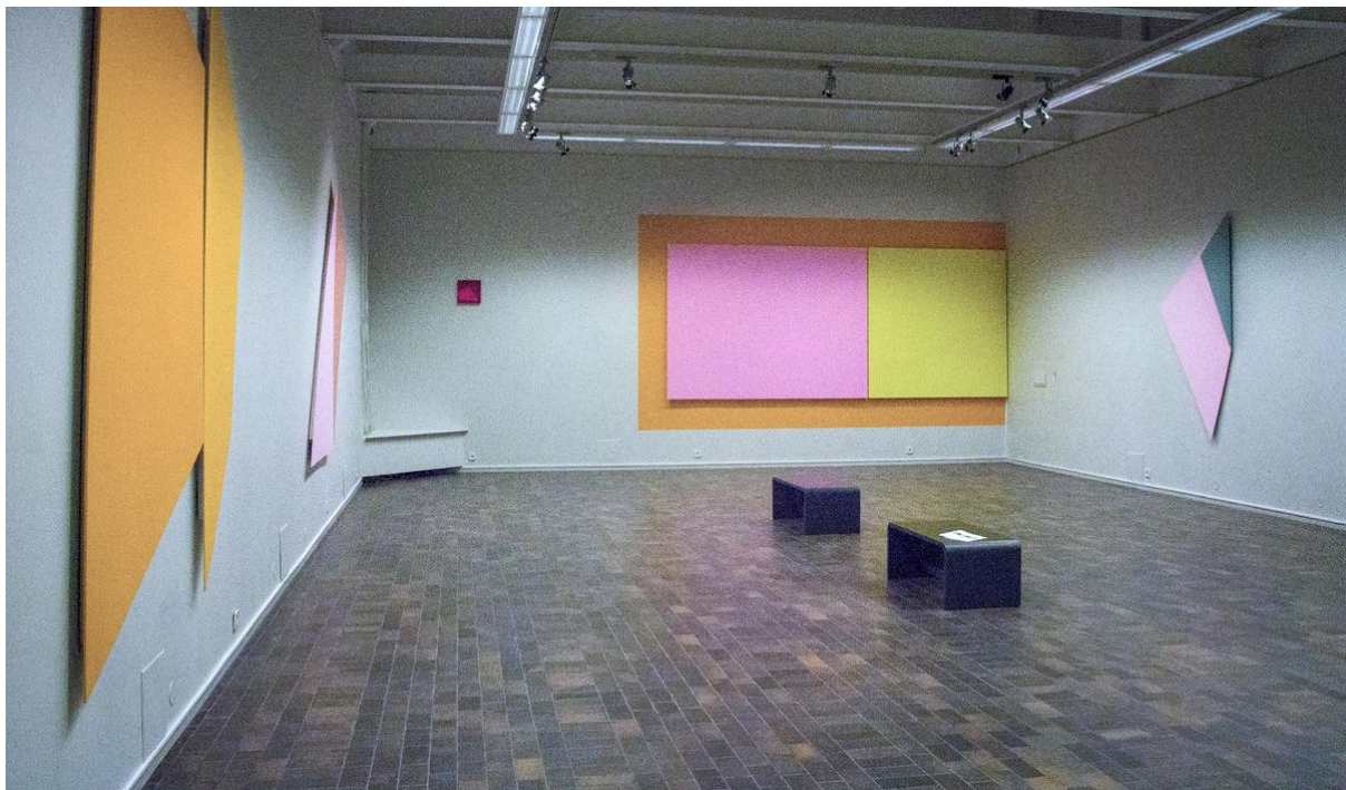
Den stora, "extroverta" salen.